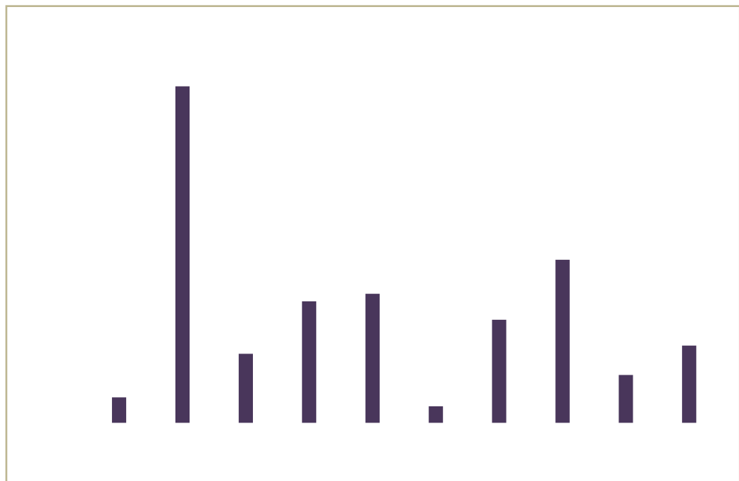
Figure 3. Nombre de chirurgie de trachome (janvier- septembre) et cible annuelle, 2016, Région de l'Amhara, Ethiopie

2016, 106, 152, 82 000, 2016, 81%, 102 476, 3, 2016, 2016.